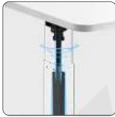
Potentes columnas elevadoras