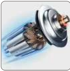
Motor robusto y resistente