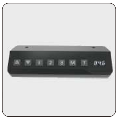
Panel de control de botones