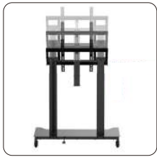
Ajuste de altura