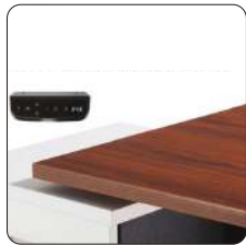
Rango de altura programable