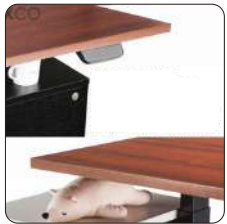
Sistema para evitar colisiones