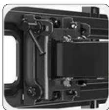
nivel de pantalla ajustable