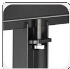
Cerraduras de seguridad