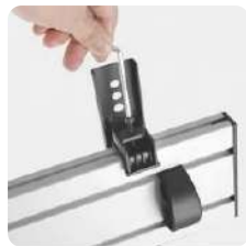
Ajuste de nivel