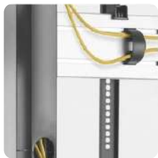
Gestión de cables